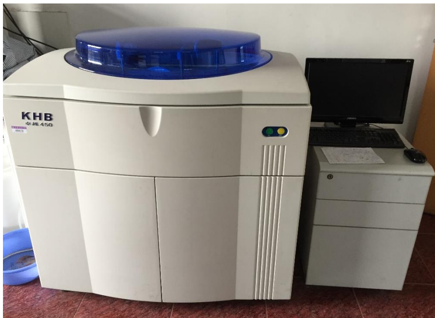
科华全自动生化分析仪