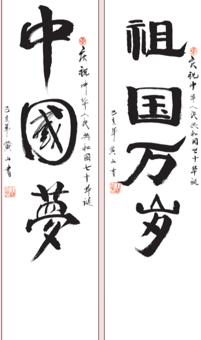
▲书法作品 71届口腔系校友 黄建生 书