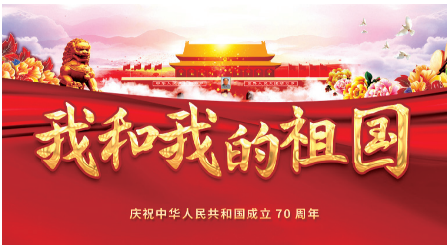
庆祝中华人民共和国成立70周年